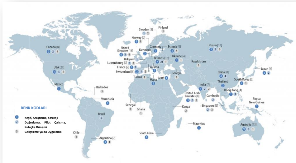
Şekil 2: 2018 Yılı Ülkelerin Kamu Sektöründe Blokchain Girişimleri

Tablo 1’den de anlaşılacağı gibi devletin sunması gerektiği düşünülen, vatandaşına sağlamakta olduğu pozitif statü haklarına bağlı hizmetlerin çoğu (güvenlik, sağlık, eğitim, vd.) blokchain teknolojisi ile sunulma imkânına sahiptir. Aşağıda ülkelerin kamu sektöründe blokchain girişimleri ile ilgili OECD analizi yer almaktadır.